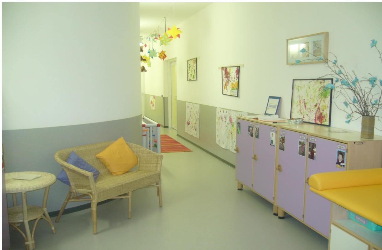
Spazi interni nido

Il mancato pagamento della retta per due mesi consecutivi o la mancata frequenza per un mese consecutivo (non giustificata da certificazione medica o da altro valido motivo opportunamente documentato) comporta la dimissione d'ufficio del minore dall'Asilo nido e la corresponsione di un mese di retta aggiuntivo, equivalente al preavviso normalmente richiesto.